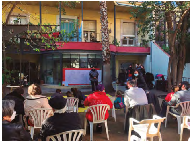
▲ Presentació del conte I es va fer la llum

Des d'Enginyeria Sense Fronteres, aquest no és el primer conte que tenim. De fet, el grup Equador fa anys que treballa diferents històries que es van publicant al voltant d'una mateixa protagonista, que és una granota que es diu Auca. El que es pretén amb aquestes històries és sensibilitzar sobre la problemàtica de l'extractivisme i l'afectació sobre l'aigua a l'Amazònia Equatoriana. D'una manera molt diferent, “I es va fer la llum”, el que pretén és sensibilitzar sobre la pobresa energètica.